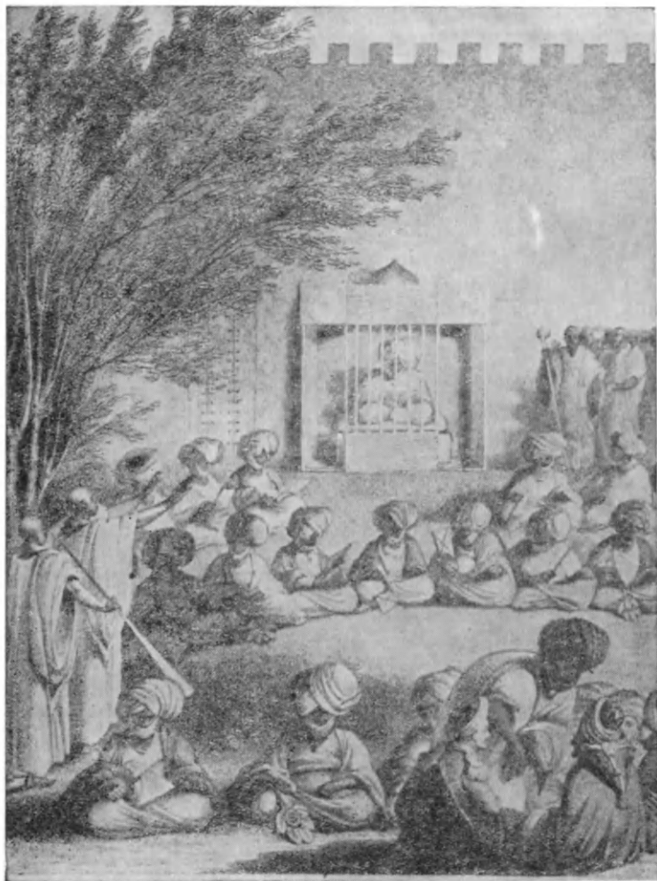
Аудиенция у султана Борну

восторг порохе», — отмечал Денэм в письме Уоррингтону 4 апреля 1823 года. При этом майор рекомендовал прислать шейху тридцать-сорок мушкетов и два верблюжьих вьюка пороха, что, как он полагал, сделало бы ал-Канеми более сговорчивым во всех вопросах, в