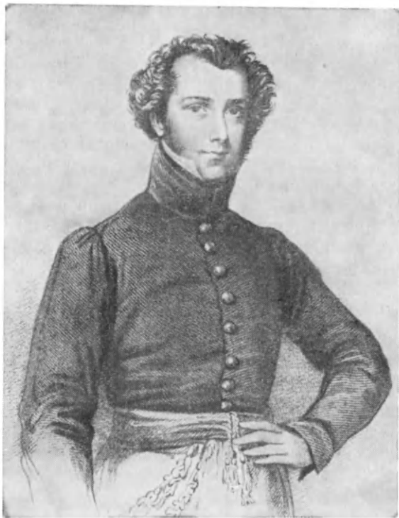
Александр Гордон Лэнг

«Хауса». Лэнг их много и подробно расспрашивал, но очень скоро на собственном опыте убедился в том, что поняли руководители Африканского общества еще в начале 90-х годов: никакой ясной и непротиворечивой картины внутренних областей Западной Африки по этим рассказам создать нельзя. Отсюда следовало только одно — кто-то должен продолжить дело Хаутона и Парка. И лейтенант Лэнг счел свою кандидатуру наиболее подходящей.