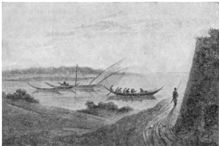
Пироги на Бенуэ

до сих пор приходилось встречаться на африканских дорогах. Да и было за что: пребывание в Дженне стало едва ли не самым приятным эпизодом его долгого и, как мы не раз уже видели, очень и очень нелегкого путешествия в Томбукту.