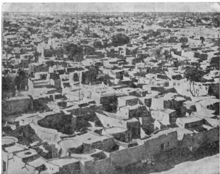
Кано. Общий вид

только на рассвете. Территория города напоминает овал неправильной формы; большое стоячее озеро Джакара как бы рассекает его с востока на запад на две части. Через озеро тянется узкая полоса земли, на которой расположен рынок. В период дождей она затопляется, и в связи с этим вся торговля приурочивается к сухому сезону.